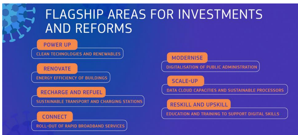
Obrázek 2 - Vlajkové iniciativy RRF

Granty NPO musí být zázavazkovány ze 70 % do 2022 a zbytek do 2023. Každá iniciativa v plánu musí obsahovat jasné milníky a cíle. Proplácení prostředků od EU proběhne až po jejich naplnění, předem dostane ČR jen 10 %. Všechny výše uvedená pravidla značně omezují rozsah a typ iniciativ, které je možné do NPO zahrnout. V první fázi tedy mohou státý předložit návrh plánu k diskusi s EK ohledně jeho nastavení. To premiér učinil 15.10. a jednání s EK aktuálně probíhají.